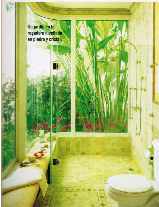
Un jardín en la regadera diseñada en piedra y cristal.