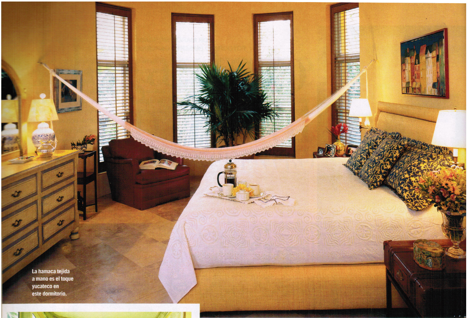
La hamaca tejida a mano es el toque yucateco en este dormitorio.